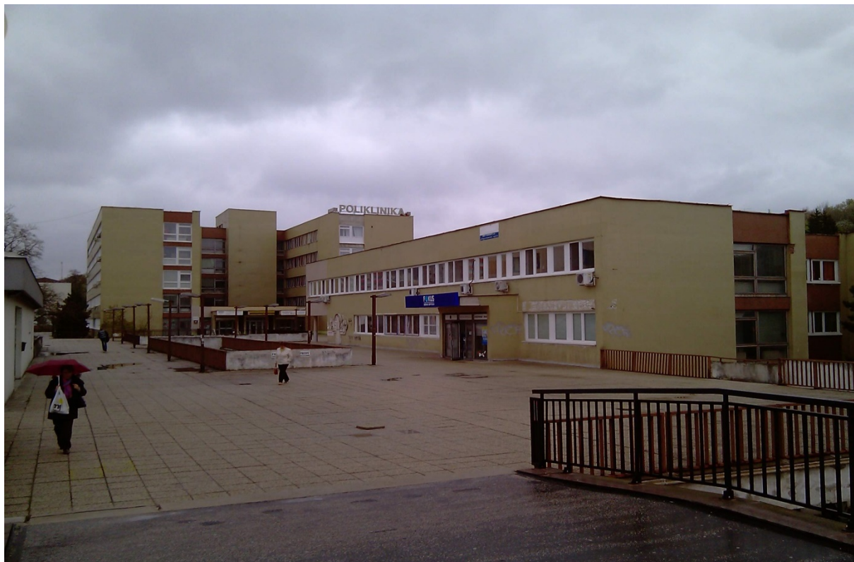
budova sanatória – Donnerova 1 (súpisné číslo 716)